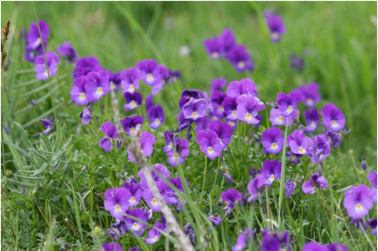
Le bleu délicat des raiponces rivalise avec le mauve des pensées tapies sous les herbes.